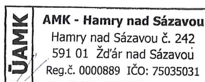
statutární zástupce organizace