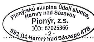
statutární zástupce organizace